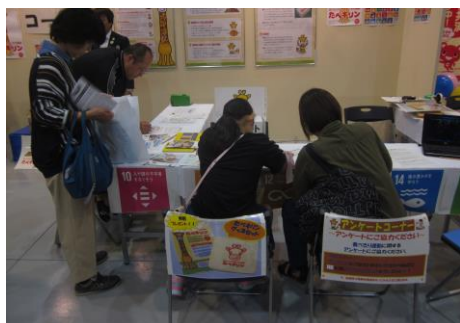
KNB秋の大収穫祭での啓発

平成30年6月に富山市は、内閣府が選定するSDGsの達成について、優れた取組を提案する自治体「SDGs未来都市」の29都市の1つに選ばれ、さらにその中で特に先導的な取組「自治体SDGsモデル事業」の10事業の1つにも選ばれました。