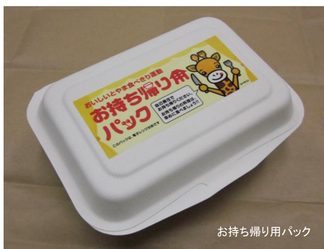
お持ち帰り用パック

この事業は、お持ち帰り自体を推進するものではなく、料理を「食べきる」ための一つの選択肢として実施しています。この他にも、自主的に、お持ち帰り用パックを用意しているお店もありますので、お持ち帰りを検討される場合は、お店に確認してみましょう。